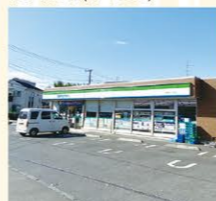
ファミリーマート東有馬二丁目店 徒歩約2分(約150M)