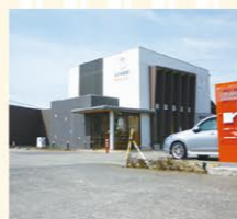
野川メディカルセンター (小児科、皮膚科、耳鼻科) 徒歩約6分(約450M)