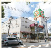
ライフ東有馬店 徒歩約12分(約900M)