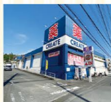
クリエイトSD川崎野川店 徒歩約1分(約80M)