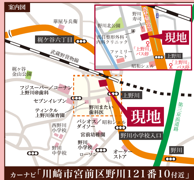
カーナビ「川崎市宮前区野川121番10付近」

【上野川 物件概要】 ■所在地/川崎市宮前区野川121番33・34 ■交通/東急田園都市線「梶が谷」駅バス10分徒歩1分、「宮前平」駅バス10分徒歩1分、JR南武線「武蔵新城」駅バス15分徒歩2分 ■販売区画数/全2区画 ■販売価格/A:2,350万円・B:2,450万円 ■敷地面積/A:101.29㎡(30.64坪)・B:103.02㎡(31.16坪) ■土地権利/所有権 ■地目/宅地 ■接面道路/南側約5.0M ■現況/更地 ■引渡/即可能 ■都市計画/市街化区域 ■用途地域/準住居地域 ■建ぺい率/60% ■容積率/200% ■設備/公営水道・公共下水・都市ガス・東京電力 ■備考/開発道路・ゴミ置場持分各1/6有 ■取引態様/媒介